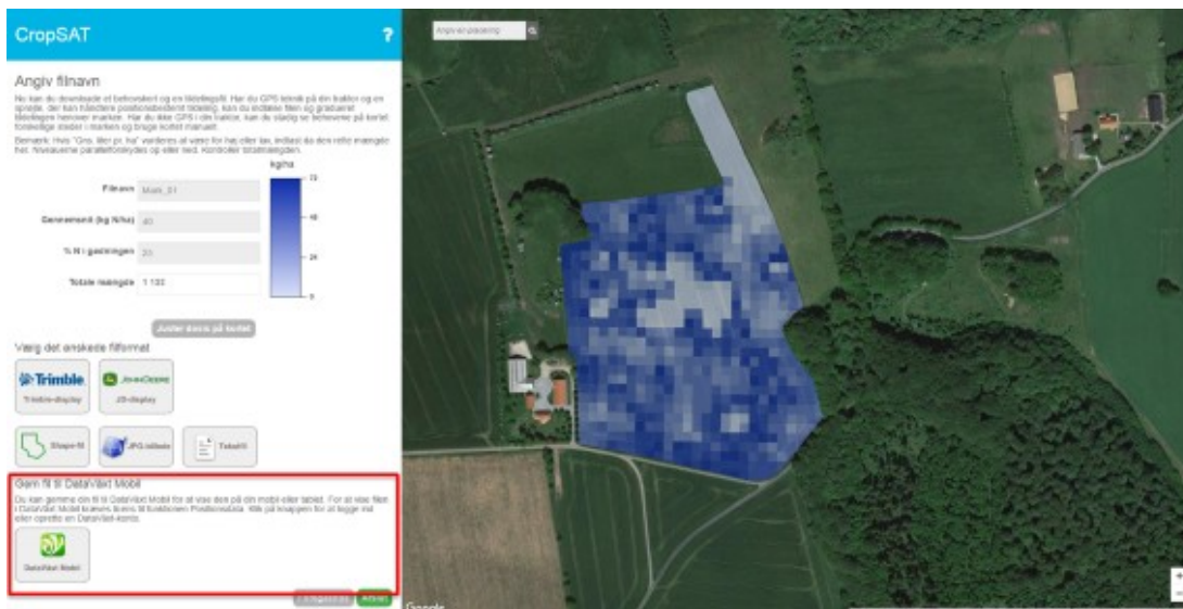
Figur 2. Når du har lavet dit tildelingskort i CropSAT trykker du på "DataVäxt Mobil", hvorefter tildelingskortet suser op i "skyen".

Ved hjælp af CropSAT.dk laver du et graderet tildelingskort ud fra biomassen på din mark. Men i stedet for at downloade tildelingskortet som en shapefil, der kan indlæses i din traktorterminal, klikker du på knappen med logoet for "DataVäxt Mobil" – Se figur 2.